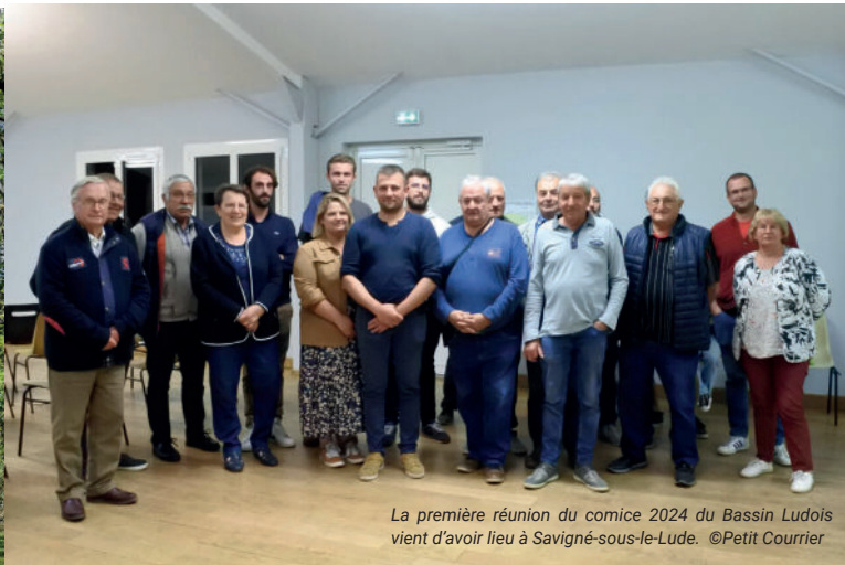
La première réunion du comice 2024 du Bassin Ludois vient d'avoir lieu à Savigné-sous-le-Lude.