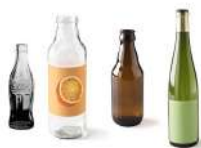
Bouteilles en verre (jus de fruits, vin, bière...)

Voici quelques exemples de déchets acceptés dans les conteneurs :