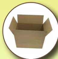
Cartons Merci de les aplatir