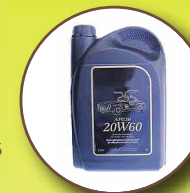
Huiles usagées (de friture et de vidange)