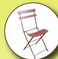
Ferraille cadre de vélo, grillage, mobilier en ferraille