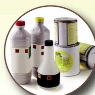
Déchets dangereux (peintures, aérosols, radiographies...)