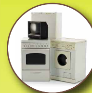
Déchets d'équipement électriques et électroniques