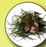
Déchets végétaux (taille de haies, tonte de jardin,...)