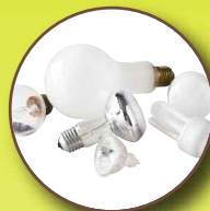
Ampoules et néons