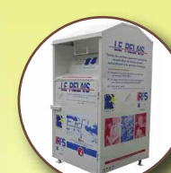
Textiles (vêtements et chaussures)