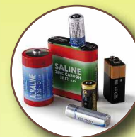
Piles, accumulateurs, batteries