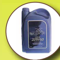
Huiles usagées (de friture et de vidange)