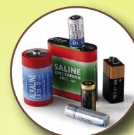
Piles, accumulateurs, batteries