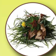
Déchets végétaux (taille de haies, tonte de jardin,...)