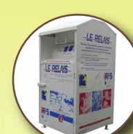
Textiles (vêtements et chaussures)